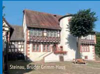
Steinau, Brüder Grimm-Haus